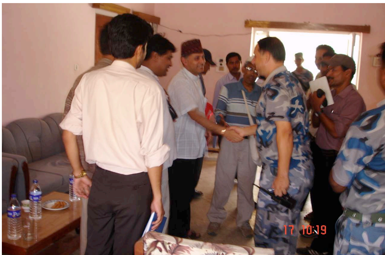
सुरक्षाकर्मीसँग तथ्य अध्ययन टोली

२०६२ जेठ ३० गते राती अन्दाजी १२:०० बजेको समयमा करिब एक दर्जनको संख्यामा रहेका हतियारधारीहरू सशस्त्र प्रहरीका डेरा रहेका घरमा आए। चौमालास्थित सशस्त्र प्रहरी बल बनबेहडाको दक्षिणपट्टी भण्डै डेढ सय मिटर दूरीमा रहेका घरहरूमा हतियारधारीहरूले ढोका ढक्क्याए। मध्यरातमा ढोका ढक्क्याउँदा डेराएर खाटमुनि लुकी कतिपयले ज्यान जोगाएका भए तापनि छुट्टाछुट्टै घरका दुई कोठामा रहेका तीन महिला, एक काखे बालक र दुई पुरुष चाहिँ अपहरणमा परे।