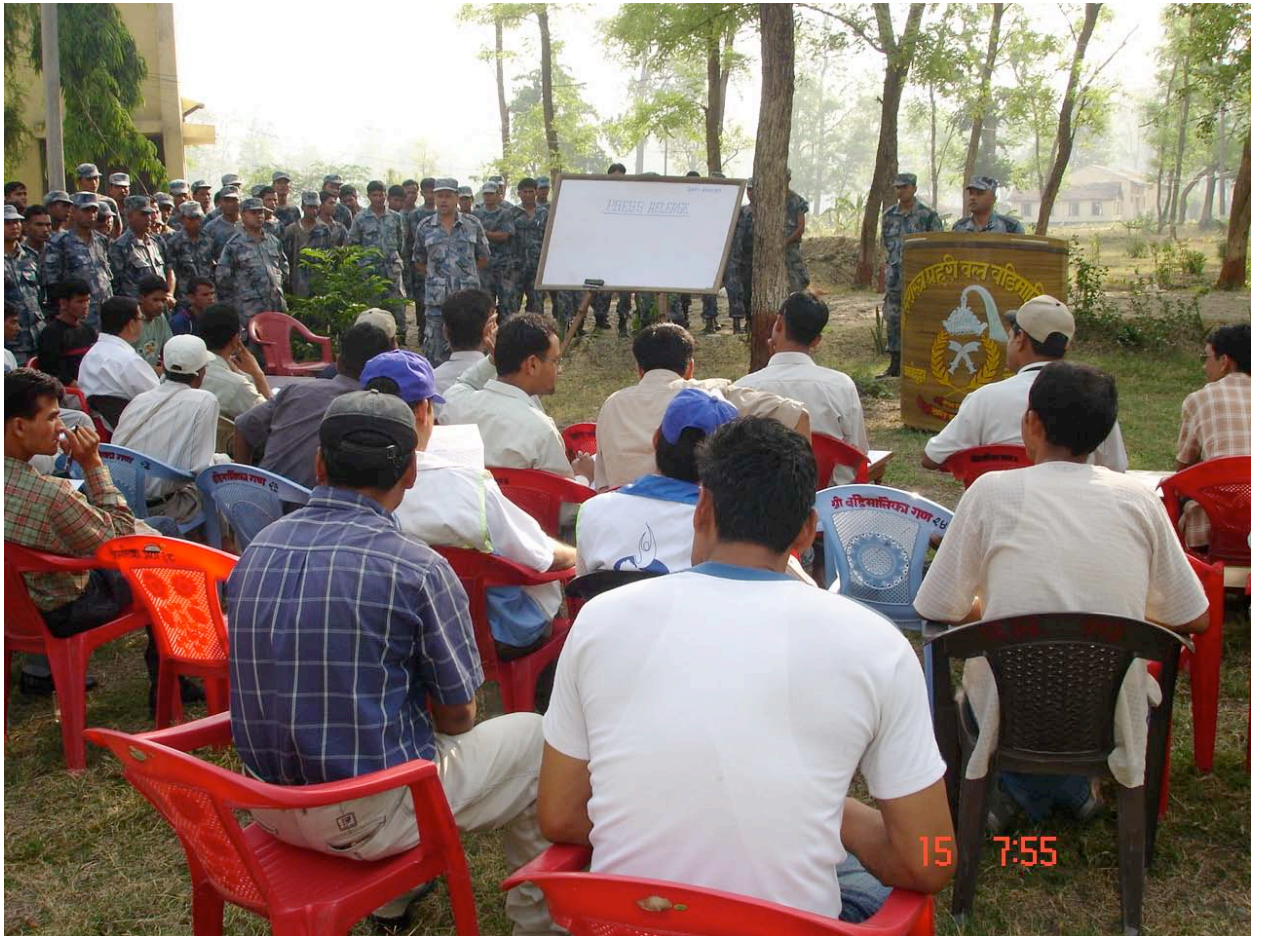
सुरक्षाकर्मीद्वारा गरिएको पत्रकार सम्मेलन

हामीले गरेका गल्तीहरू हामीले स्वीकार गरेका छौं र उनीहरूले गरेको गल्तीको जिम्मा उनीहरूले लिनु पर्छ। कतै यो गुण्डागर्दी हो कि ! माओवादीले पनि निष्पक्ष छानबिन गर्नुपर्छ। पिस किपिडमा हामीले के गर्ने, के नगर्ने हामीले हाम्रा केटाहरूलाई राम्ररी कन्सेप्ट क्लियर गराएका छौं। फिल्डमा जानु भन्दा अगाडि मानवअधिकार सम्बन्धमा हाम्रा जवानहरूलाई राम्ररी ज्ञान गराउँछौं। यहाँ मानवअधिकारवादीहरूले बढी गहिरिएर चासो लिइदिनुपर्छ। निष्पक्ष छानबिन गरिनु पर्छ।