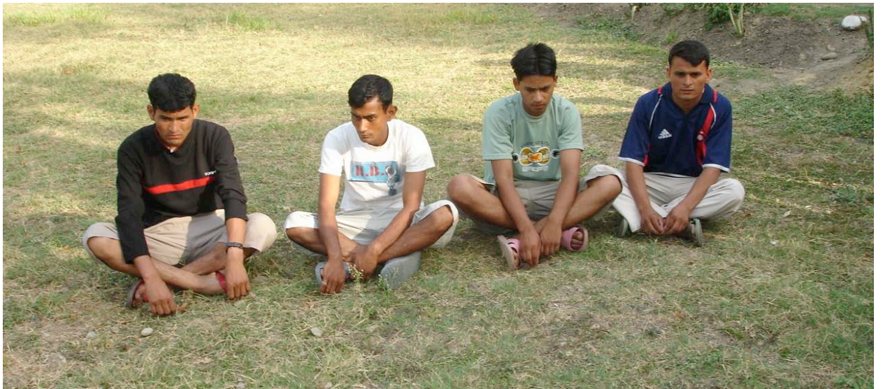
मृतकका पति तथा आफन्त

सुरक्षाको हाम्रो प्याट्रोलिङ्ग राती हुँदैन, दिउँसो मात्र हुन्छ। तर त्यस दिन कुनै जानकारी आएको भए हामी राती पनि प्याट्रोलिङ्ग गर्थ्यौं। यो घटनापछि एक महिलाले ठाउँ ठाउँमा ब्लफ कल गरेर “बनबेहडाको घटना देखिस् ? तेरो पनि