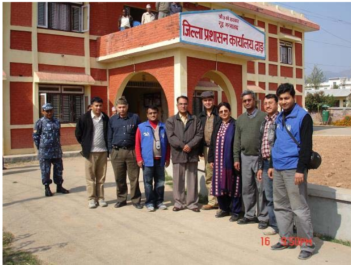
स्थलगत अध्ययनटोली दाङ जिल्ला प्रशासनकार्यालयमा

गृहमन्त्रीज्यूको माघ २५ गतेको सुरक्षाकर्मीलाई असीमित अधिकार प्रदान गरिएको भनाइले अन्यौल एवं अस्पष्टता अनुभव भएको छ । नगर निर्वाचन सम्पन्न गराउने सिलसिलामा सुरक्षाकर्मीहरूलाई अत्यधिक कार्यबोझका कारण उनीहरूमाथि चर्को मानसिक तथा शारिरीक दबाव परिरहेको परिस्थिती विद्यमान छ । उदाहरणका लागि माघ २६ गते खटिएको टोलीलाई अघिल्लो रातदेखि नै निरन्तर गस्तीमा खटाइएको थियो । निर्वाचन शान्ति सुरक्षाको मात्र विषय नभई मूलभुत रूपमा राजनीतिक प्रक्रिया भएकोले यस जिल्लाको प्रशासन तथा सुरक्षा निकायको तर्फबाट हामीले सम्बन्धित माथिल्लो निकायमा सोही बमोजिमको व्यहोरा समेत जाहेर गरेका थियौं ।